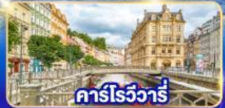
คาร์โรวารี