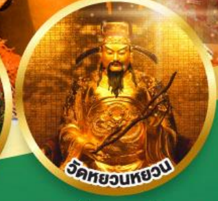
วัดหยวนหยวน

ขอพรเรื่องสุขภาพ, โชคลาภ ความสำเร็จก้าวหน้า