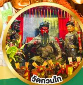
วัดกวนโก