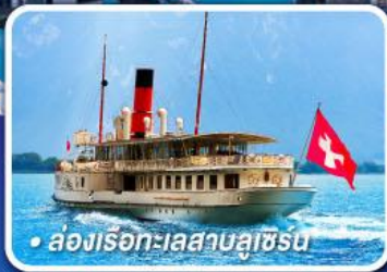
• ล่องเรือทะเลสาบลูซิร์น