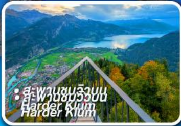
• ส.พานชมริบม Harder Klettersteig