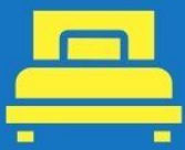
ห้องพักเดี่ยว SINGLE

ตัวอย่างประเภทห้องพัก *เป็นเพียงตัวอย่างเพื่อให้เห็นภาพสำหรับประเภทห้องในแบบต่างๆ