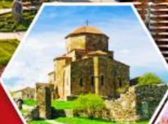
อิมารลอรี