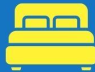
ห้องพักดับเบิล DOUBLE