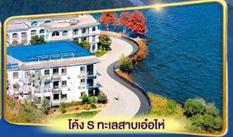
โค้ง S ทะเลสาบเอ่อไห่