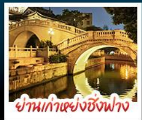
ย่านทากูไ้เซ็งฟาง