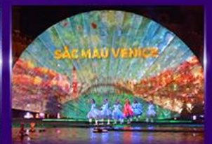
Sac Mau Venice Show