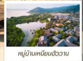
หมู่บ้านเหนียนฮิววาน

🧳 โหลด 23 KG. x1 ทั้งไป - กลับ ✓ พรีเมียมทิวร ✓ ไม่เข้าร้านรัฐบาล ✓ ทิวรกรุ๊ปเล็ก ✓ รวมค่าเข้าชมสถานที่ตามโปรแกรม