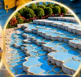
ปานุกคาล่ Pamukkale