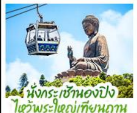
นั่งกระเช้าเองปีง ไหว้พระใหญ่เทียนถาน