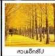
สวนเอ็กซ์โป