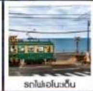
รถไฟโอโนะเด็น