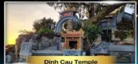
Dinh Cau Temple