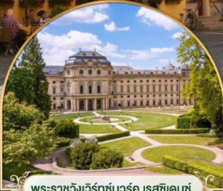
พระราชวังแวร์ซายส์ ฝรั่งเศส