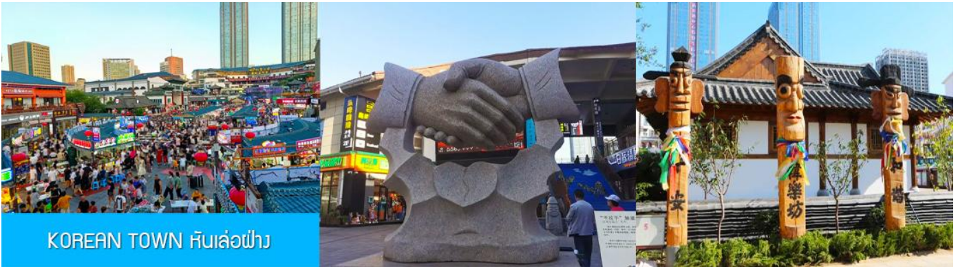
KOREAN TOWN หันเล่อฝาง