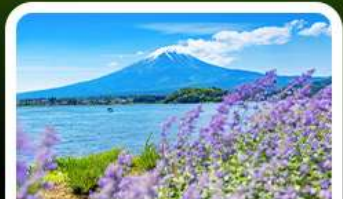
สวนโอะอิชิ ปาร์ค