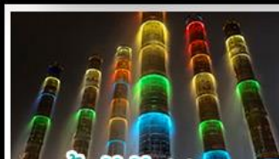
น้ำพุไม้ไฟตักSKP