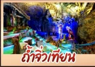
ถ้ำจิวเทียน