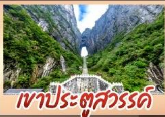
เขาประตูล้ำวรรณคดี