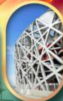
ผ่านชมสนามกีฬาาริงนก