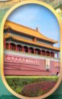
จัสมุตรีสเทียนอันเหมิน