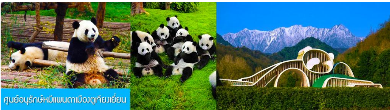
ศูนย์อนุรักษ์หมีแพนด้าเมืองตูเจียงเยียน