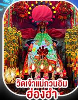
วัดเจ้าแม่กวนอิม ฮ่องอ่า