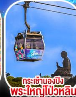
กระเช้าเองปีง พระใหญ่โป่วหลิน