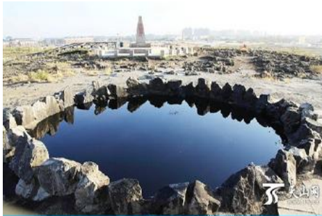
บ่อน้ำมันสีดำ

ระหว่างทางแวะรับประทานอาหารกลางวัน ณ ภัตตาคาร (11)