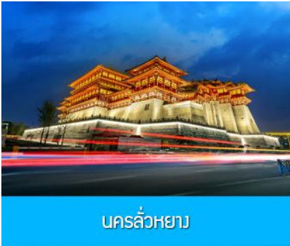
นครลั่วหยาง