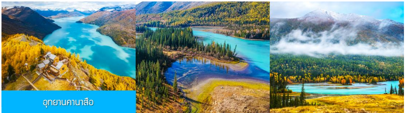
อุทยานคานาสีอ