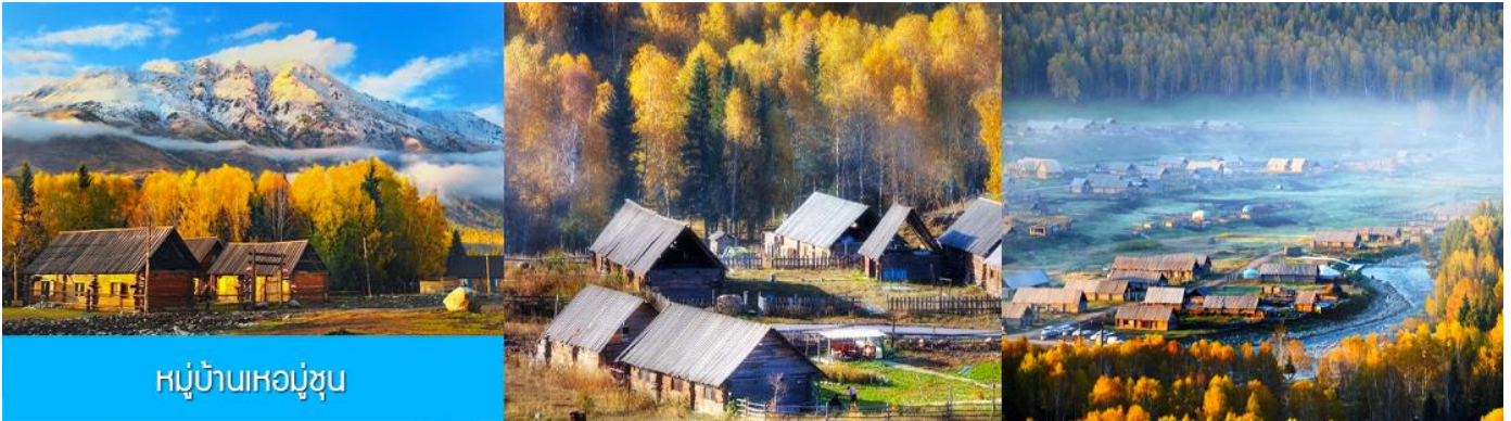
หมู่บ้านหอมุ่มซุน

พักที่ SU TONG HOLIDAY HOTEL โรงแรมระดับ 4 ดาวท้องถิ่น หรือเทียบเท่าในเมืองปูเอ๋อจิน