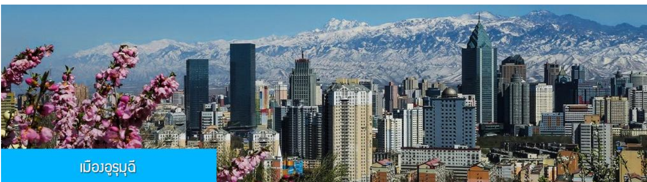
เมืองอูรูมูดี

พักที่ MERCURE HOTEL โรงแรมระดับ 4 ดาวท้องถิ่นหรือเทียบเท่าในเมืองวูรูมูดี