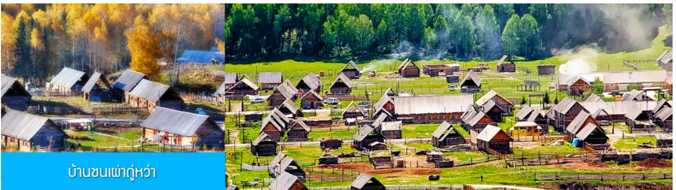
บ้านชนเผ่าอุ๋วหว่า

นำท่านเที่ยวชม หมู่บ้านหอมุ่มซุน 禾木村 หมู่บ้านโบราณที่ขึ้นชื่อด้วยทัศนียภาพที่สวยงามท่ามกลางความสงบ เป็นชุมชนของชนเผ่าอุ๋วหว่าที่เป็นชนพื้นเมืองในเขตมณฑลโกเลีย ที่เป็นชนกลุ่มน้อยที่เก่าแก่ที่สุดในจีนพำนักอาศัยอยู่ หมู่บ้านแห่งนี้ ตั้งอยู่ในเขตอุทยานคานาสีอ ทางฝั่งตะวันตกเฉียงใต้ของเทือกเขาอัลไต หมู่บ้านนี้ได้รับการขนานนามว่าเป็นหมู่บ้านชนเผ่าที่มีเอกลักษณ์โดดเด่น ถูกจัดลำดับเป็นหนึ่งในหกหมู่บ้าน โบราณที่ดีที่สุด และหนึ่งในแปดสถานที่ถ่ายทำภาพยนตร์ยอดเยี่ยมของจีน มีแม่น้ำหอมุ่มไหลผ่านหมู่บ้าน ด้วยทัศนียภาพที่สวยงามท่ามกลางความสงบแห่งธรรมชาติ หมู่บ้านแห่งนี้มีช่างภาพ นักวาดเขียนและนักท่องเที่ยวต่างมาเยือนอย่างไม่