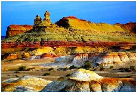
เมืองผีวูเอ้อเหอ

พักที่ XI BU WU ZHEN HOTEL ระดับ 4 ดาวท้องถิ่นหรือเทียบเท่าในเมืองวูเอ้อเหอ