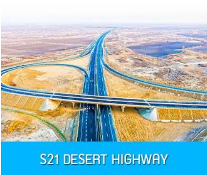
S21 DESERT HIGHWAY