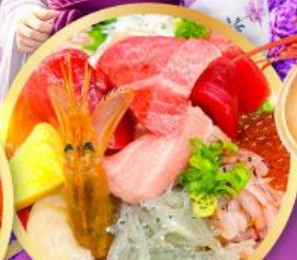
ตลาดปลาชิบิสุ คาชิโนะอิชิ