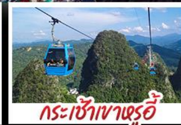
กระเช้าเขาค้อ