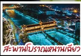
สะพานโบราณหนานเหลียว