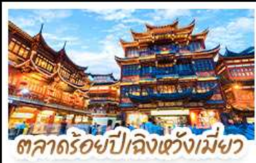
ตลาดร้อยปีลิ่งเซวี่งเม่ิง