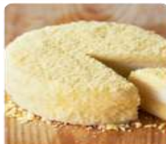
ร้าน LeTAO ร้านมีผลิตภัณฑ์อร่อย ด้วยบรรยากาศในร้านตกแต่งด้วยไม้ที่แสนอบอุ่น อีกทั้งยังมีขนมรสหลากหลายแบบให้เลือกอีกด้วย