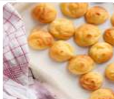
ร้าน KITAKARO ซึ่งเป็นขนมอบจากเตาสดๆ ที่เมื่อก่อนให้เด็กๆ ชอบลิ้มชิมรสกันสมัยก่อน และหารากที่จะซื้อของฝากเป็นของขวัญ