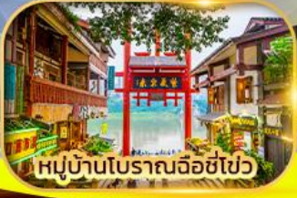
หมู่บ้านโบราณฉือซื่อไป๋