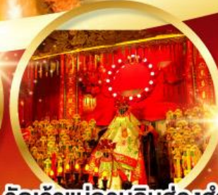
วัดเจ้าแม่กวนอิมฮ้องฮำ