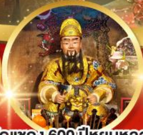
วัดแซง 600 ปีหยุดหลง