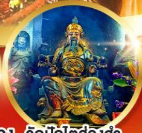
วัดปักไต้ฮ้องฮำ