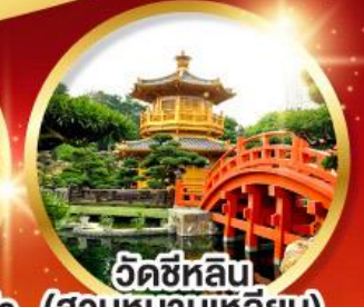
วัดซีหลิน (สวนหนานเท่ลิยง)