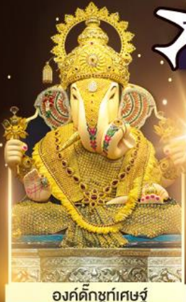
องค์ดีกษุท์เศษฐ์