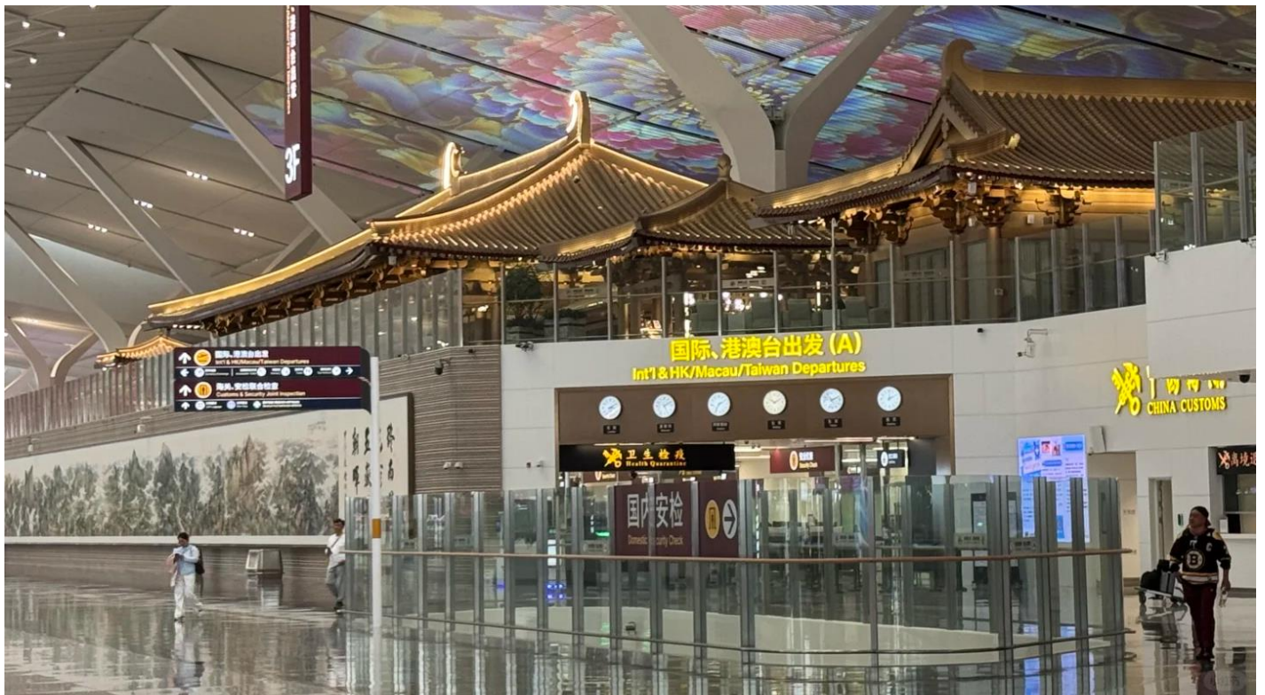
GO1XIY-SL006 บินตรงซีอาน ย้อนเวลาสู่อางอัน เจิ้งโจว ลั่วหยาง หยุนไถซาน 6 วัน 5 คืน โดยสายการบิน ไทย โลออนแอร์ (SL)