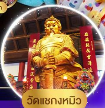
วัดแซงหมิว