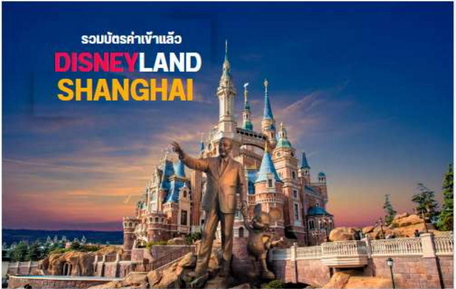
DISNEYLAND SHANGHAI ดิสนีย์แลนด์เซี่ยงไฮ้

ไม่เข้าสวนสนุก DISNEY LAND หักออก 2,000 บาท