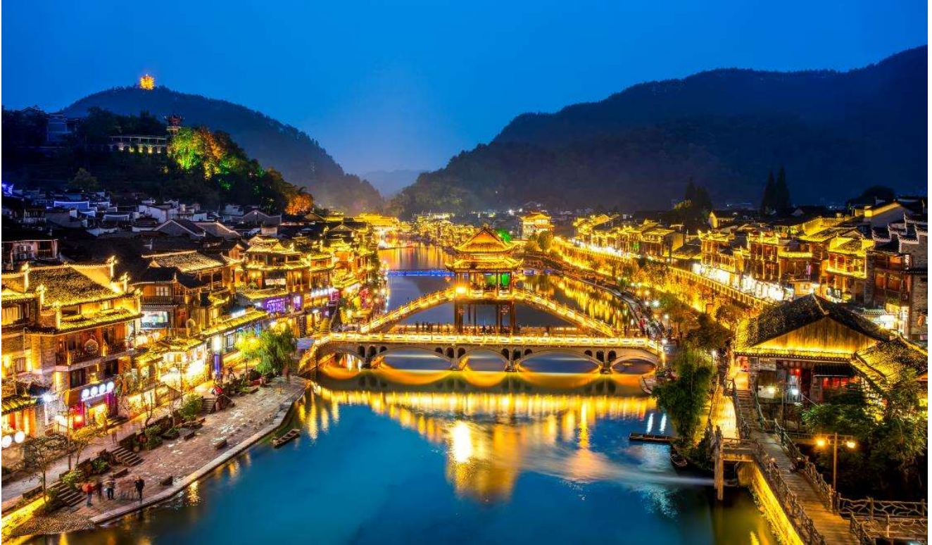
T2G-CSX15SL ฉางซา จางเจียเจี๋ย ฟู่หลงเจิ้น เฟิ่งหวง สะพานแก้ว ชมโชว์นางจิ้งจอกขาว 5D 4N (SL)