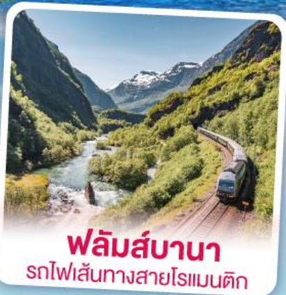
พลัมส์บานา รถไฟเส้นทางสายโรแมนติก