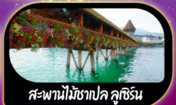
สะพานไม้ฆาปค ลูซิริน