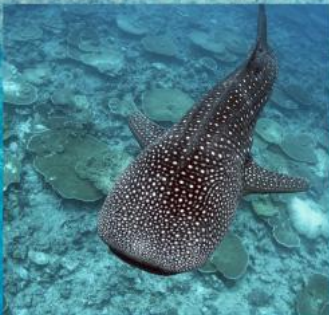
Whale Shark Snorkeling