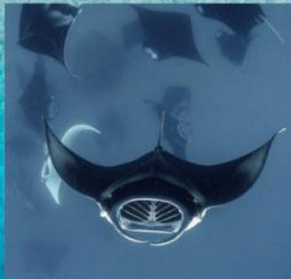
Manta Ray Snorkeling