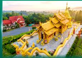
วัดพนมไพรประดิมบุรี