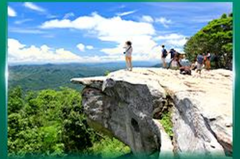
จุดชมวิวผาสุตาแผ่นดิน